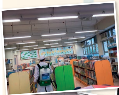
1C 張詠祈 及 4B 張睿恩家長

委員們對坊間的不同保護塗層進行深入比較，經過參考各種塗層在實驗室及臨床的數據、殺滅病毒的成效、對人體可能出現的不良反應、價格及耐用程度等資料，最終選擇了由本地大學研發的長效殺菌塗層，於全校校園範圍噴灑，並向全校家長發出溫馨提示，如何令塗層發揮最佳功效。