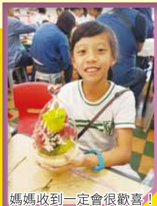
媽媽收到一定會很歡喜！