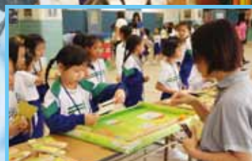
學生透過有關共融的講座及攤位遊戲，加深對社會上不同人士的認識。