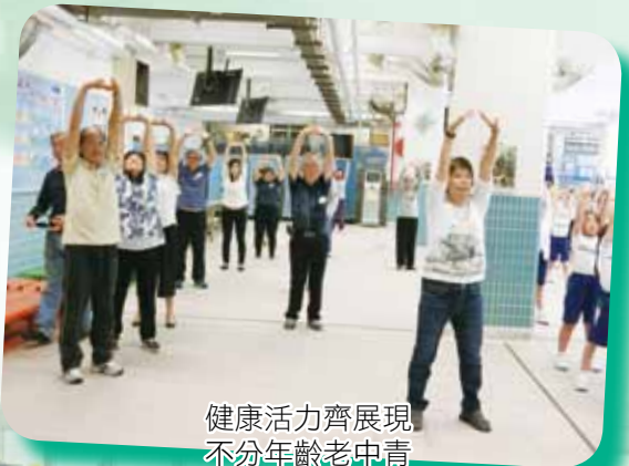
健康活力齊展現 不分年齡老中青