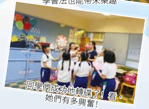
同學們成功地轉碟了！看，她們有多興奮！