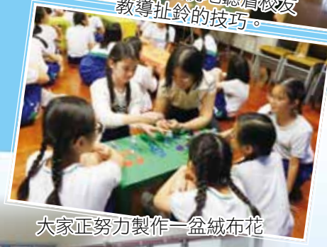
大家正努力製作一盆絨布花