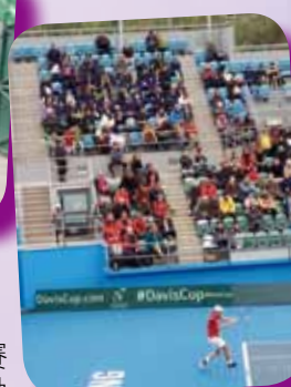
香港對伊朗的賽事打得十分緊湊