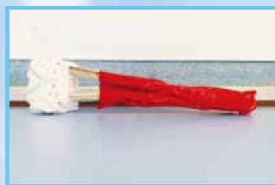
同學們嘗試為長者們利用科技打造新一代「智能家居」，提升生活質素！