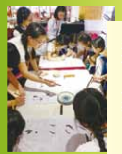
透過參訪佛山祖廟，了解嶺南的古建築風格和特色，包括木雕、石雕等富地方色彩的藝術裝飾