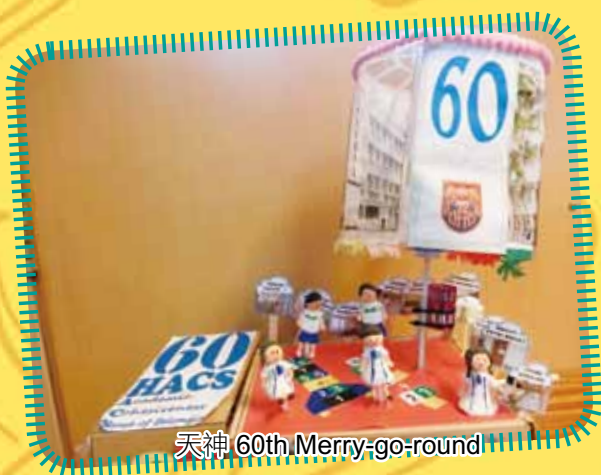
天神 60th Merry-go-round

學校本年度繼續參加由香港大學教育應用資訊科技發展研究中心推行的「電子學習支援科學科自主學習計劃」，計劃的目的是培養及發展學生的自主學習能力，裝備他們在廿一世紀中成為有自信及才能的終身學習者，並提升他們的自我學習效能。本年度畢業班學生運用簡單機械及上學年學習的聲光電原理製作能自動運行並有聲及 / 或光效的 Automata。她們亦把一個校園情景製成 Automata 作紀念及展覽以慶祝學校來年六十周年校慶。