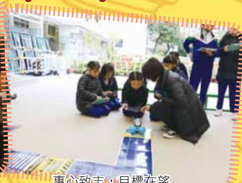
專心致志，目標在望