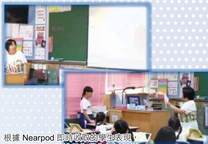
根據 Nearpod 即時收取的學生表現，教師適時作出跟進及為學生加以解說

教師認同透過電子學習，能促進課堂互動，提升學生的學習動機。教師善用 Nearpod 的課堂數據，分析了全班的學習表現，提供適時回饋，即時修訂教學策略，梳理知識，學生得以釐清迷思，提高學習成效。學生積極投入小組活動，藉着 Geogebra 的回饋，學生即時檢核答案及加以修正，能鞏固學習，亦有助教師照顧學習差異。此外，教師亦因應了學生的學習需要，靈活地安排 Geogebra 的分層學習任務，為不同能力的學生提供延伸學習的機會。