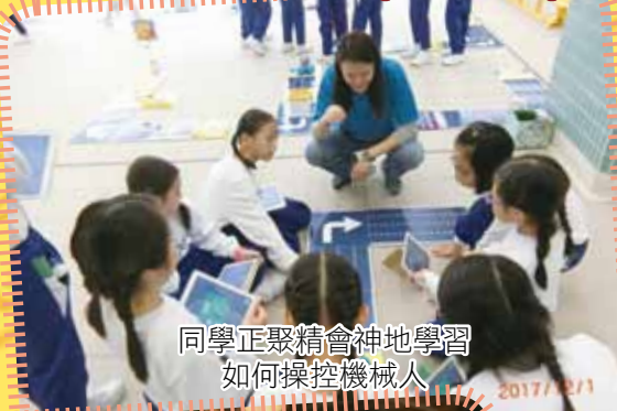
同學正聚精會神地學習 如何操控機械人