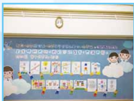
一至三年級學生透過著色及繪圖，表達對「尊重他人」這主題的了解和感受。