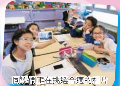
同學們正在挑選合適的相片去製作拼貼畫。