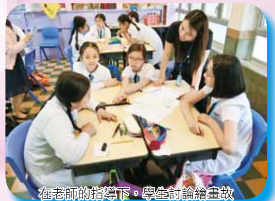
在老師的指導下，學生討論繪畫故事情節串連圖 (storyboard)