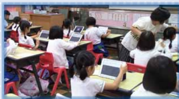
探究菱形中對角線的小秘密