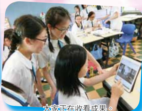
大家正在收看成果。