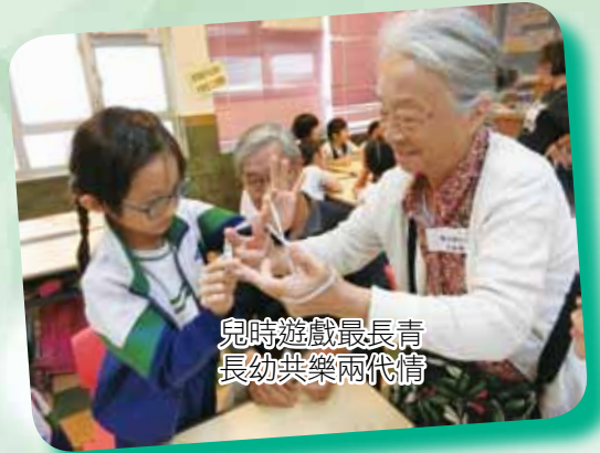
兒時遊戲最長青 長幼共樂兩代情