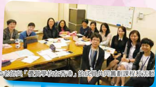
我校老師與「優質學校在香港」的成員共同籌劃課程和活動。