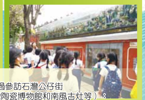
透過參訪石灣公仔街（包括廣東石灣陶瓷博物館和南風古灶等）： - 認識嶺南的陶瓷藝術及歷史 - 欣賞名家藝術珍品和年青藝術家的創作