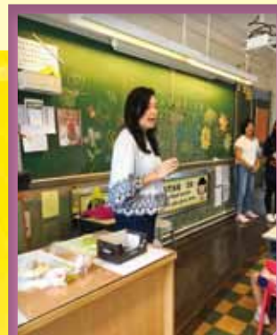
各位家長委員充當導師和助教