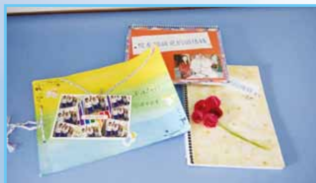
訪問後，各組學生為每位被訪者製作具特色的回憶錄。