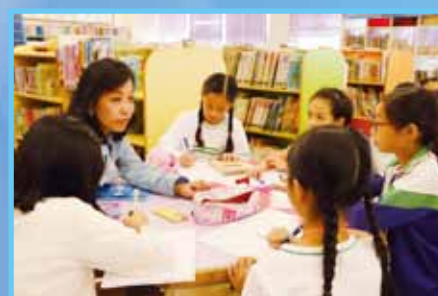
長輩樂意與同學們分享個人的經歷。