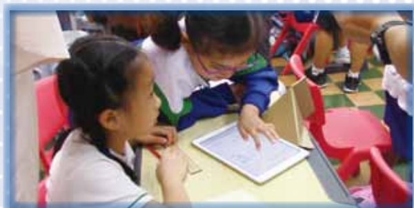
學生利用 Geogebra 製作菱形，然後即時檢視結果