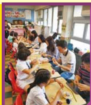
參加工作坊的爸爸人數特別多