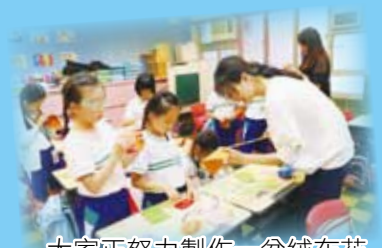
大家正努力製作一盆絨布花