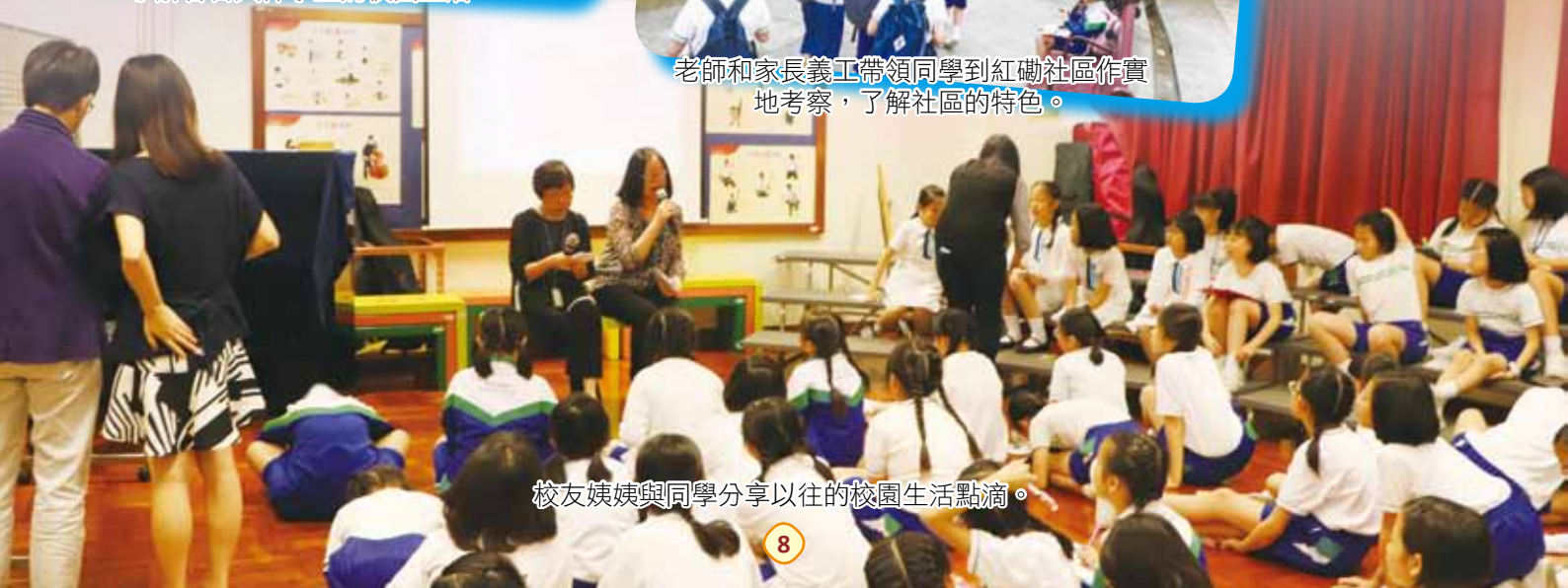
校友姨姨與同學分享以往的校園生活點滴。