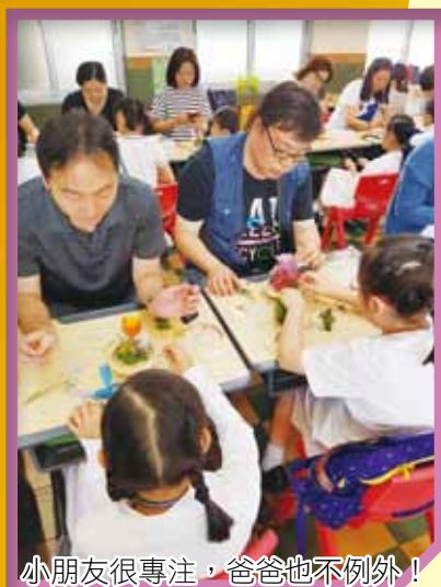
小朋友很專注，爸爸也不例外！