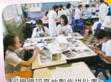
同學們認真地製作拼貼畫。

配合本學年核心價值觀培育活動主題「尊重」，透過研習周內不同形式的學習活動，讓同學明白要多從自己身邊的人或事着手，連結生活經歷，學會用同理心去關注及考慮社區不同界別人士的需要，由「愛」與「敬」出發，帶出尊重能使世界變得更和諧的訊息，從而達至「尊重身邊人與物，和諧共融樂繽紛」的果效。五、六年級的專題研習透過參與 QSHK 計劃，與中大同工合作，共同設計課程和活動，結合自主學習、體藝素養及社會參與三大元素，促進學生全人發展。