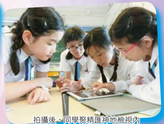
拍攝後，同學聚精匯神地檢視內容，共同商議剪輯的片段。