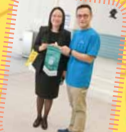
校長頒發紀念品予是 次活動負責人