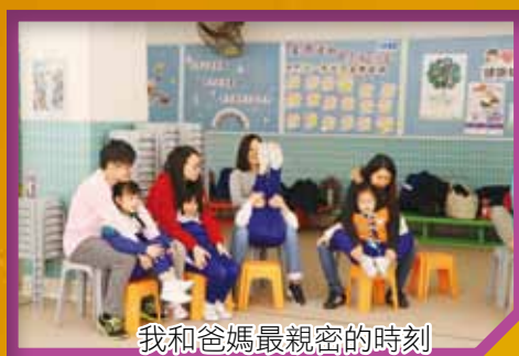
我和爸媽最親密的時刻