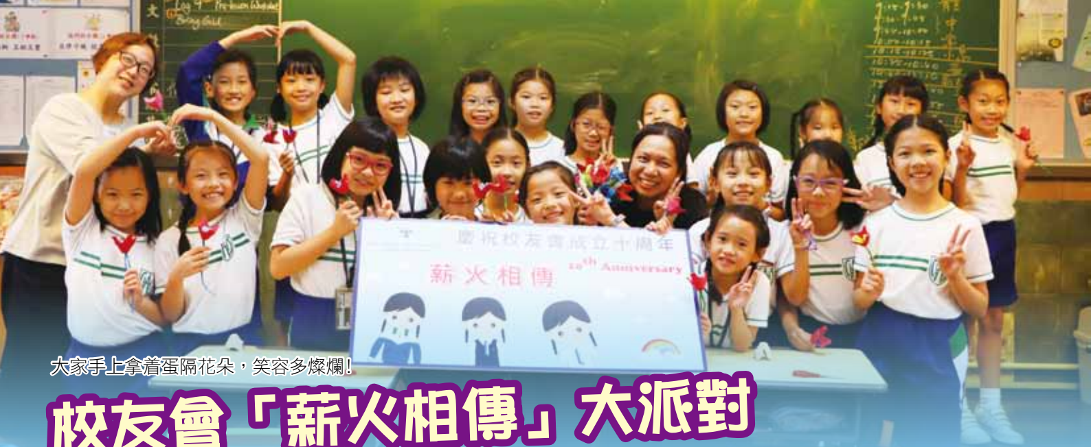
大家手上拿着蛋隔花朵，笑容多燦爛！