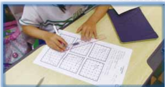
利用對角線驗證所畫的是否為菱形