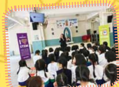
同學們聆聽校長介紹 I LOVE STEM 工作坊

STEM(科學、科技、工程及數學)的發展是廿一世紀教育的方向，可是，一般人的觀念大都認為女性在科學層面的發展總比男性遜色。因此，要在天神嘉諾撒學校這所女校推動STEM教育，必須擺脫傳統觀念，激發同學們對科學的興趣。欣喜這種理念得到家長的認同及支持，並透過家長工作機構的「員工志願者行動」計劃，在本校舉辦I LOVE STEM工作坊，讓同學在輕鬆的學習氣氛下，初步接觸微型電腦和機械人的使用及實際運作，增加同學們對科學及科技產品的普及性認識，激勵同學們繼續在科學探索之路上向前邁進。