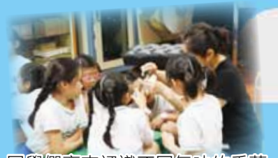
同學們齊來認識不同氣味的香薰