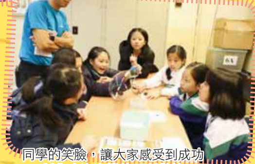
同學的笑臉，讓大家感受到成功 製作吹泡泡機的那種歡愉