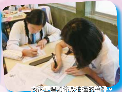
大家正埋頭修改拍攝的稿件。