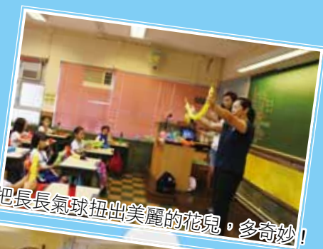
把長長氣球扭出美麗的花兒，多奇妙！