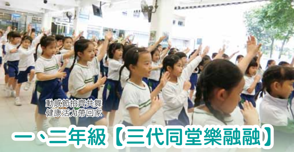
動感節拍齊共舞 健康活力帶回家