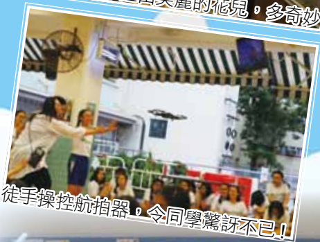
徒手操控航拍器，令同學驚訝不已！！