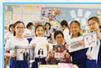
長輩們展示他們昔日的相片，細說人生的趣事。

四、五年級學習題目為「相遇在天神・回憶話當年」，活動對象為長輩。學生透過是次訪問，近距離與長輩傾談及接觸，以「細意聆聽、用心體會、感受情懷」的態度與長輩穿梭時空，細味人生點滴。我們相信每位長輩皆是人生導師，各擁豐富人生閱歷，他們記憶中的零碎片段均為啟發年青人做人處世的好點子。學生藉著活動學習尊重每個人的獨特性，欣賞長輩年青時為家庭及社會所作出的貢獻。