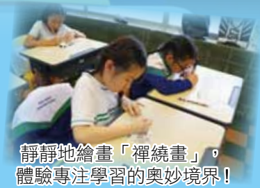
靜靜地繪畫「禪繞畫」，體驗專注學習的奧妙境界！

是次活動充分反映校友對母校的支持及那份濃濃的歸屬感，同學亦能感受到學姊們親切友愛及處事積極認真的態度。願這愛能繼續傳承下去，校友與同學們能有更多機會共聚一起，增進情誼，凝聚力量，共同協助學校發展。