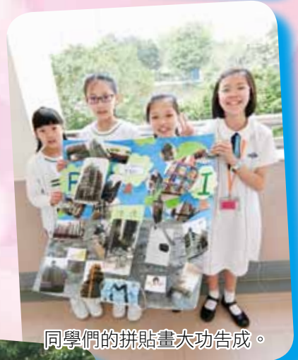
同學們的拼貼畫大功告成。