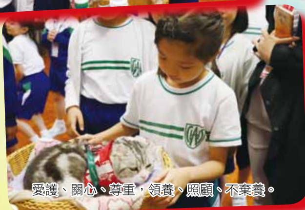
愛護、關心、尊重，領養、照顧、不棄養。