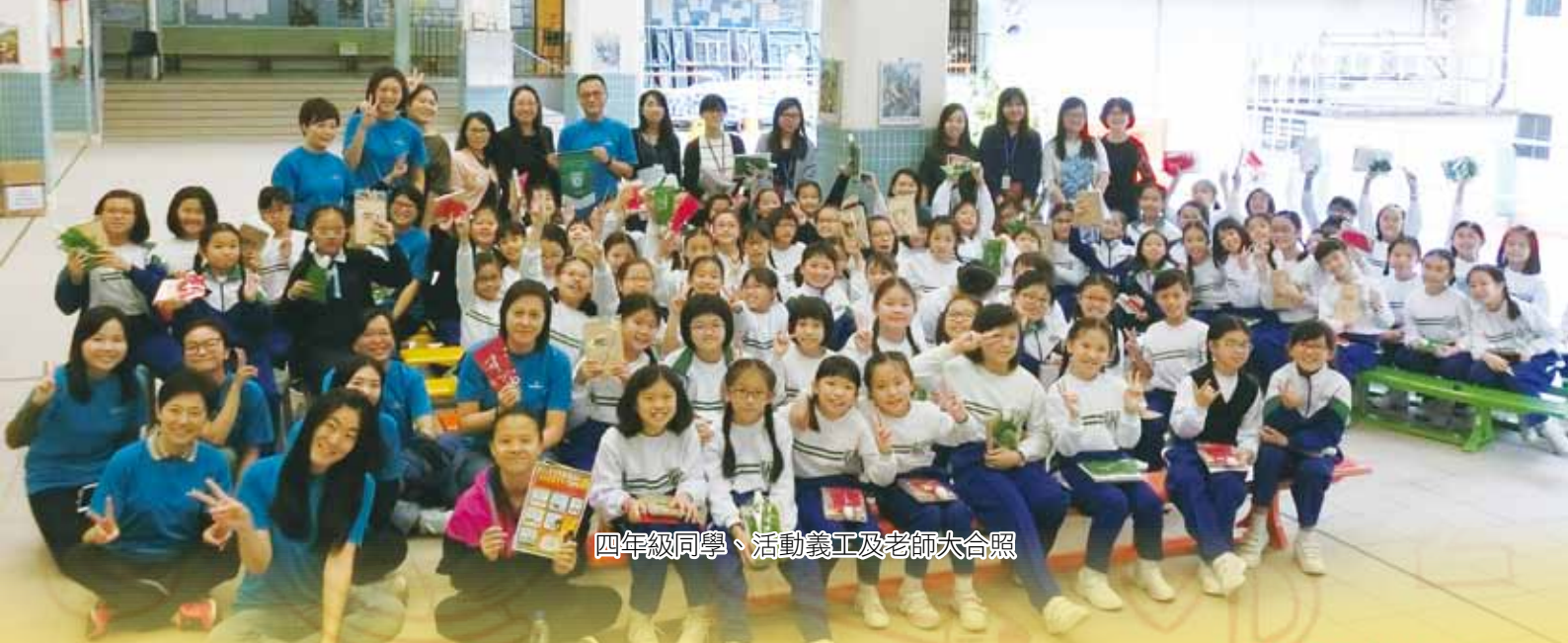
四年級同學、活動義工及老師大合照