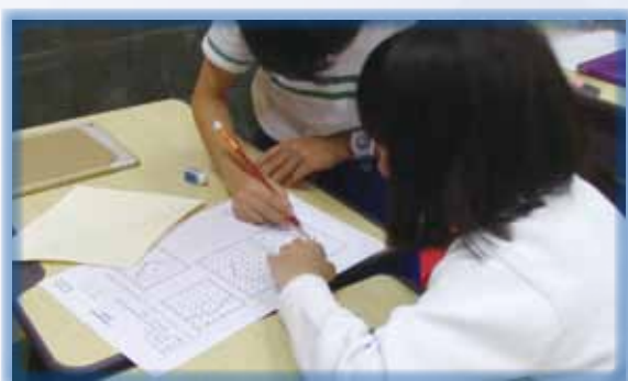
學生利用釘板圖繪出菱形