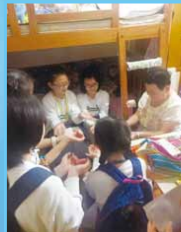
同學們與長者們一同進行「十巧手」及「椅上操」!