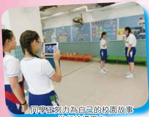
同學正努力為自己的校園故事進行拍攝工作