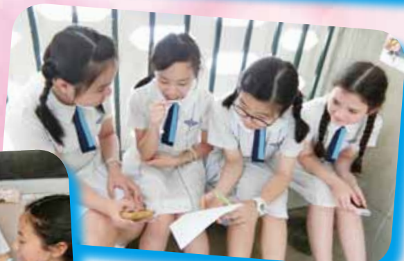
大家一起為拍攝的片段進行後期的錄音工作。