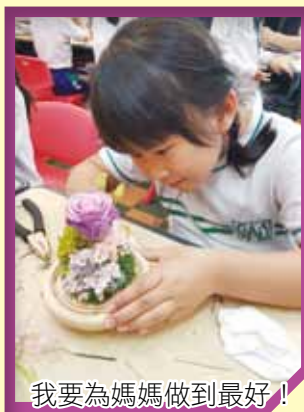
我要為媽媽做到最好！