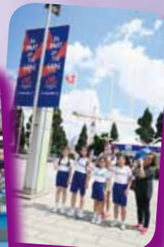
準備進場觀賞排球活動