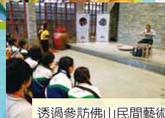
透過參訪佛山民間藝術社，認識及欣賞嶺南傳統藝術，如剪紙、雕塑、鑄塑等