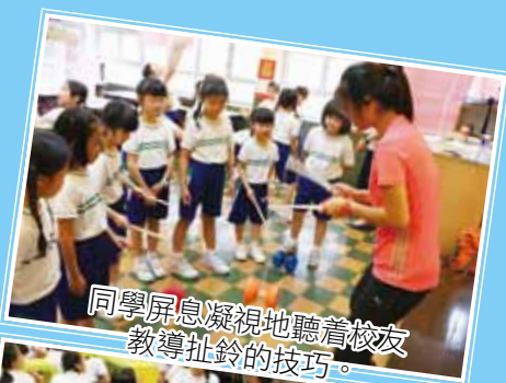
同學屏息凝視地聽着校友教導扯鈴的技巧。