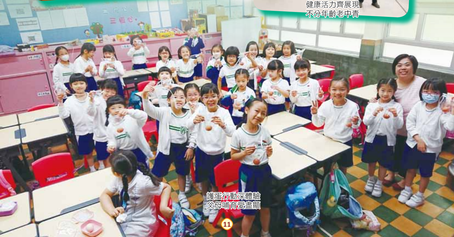
護蛋行動深體驗 父母哺育愛盡顯