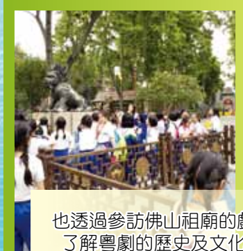
也透過參訪佛山祖廟的戲台，了解粵劇的歷史及文化特色