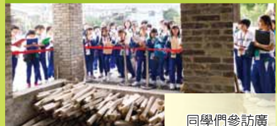
同學們參訪廣東省博物館內的展館，了解嶺南文化及其特色