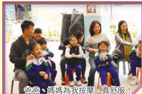
爸爸、媽媽為我按摩，真舒服！