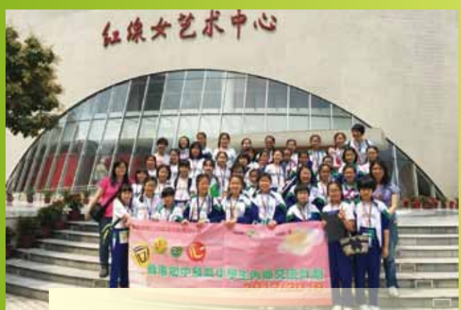
透過參訪粵劇活動中心了解粵劇的歷史、文化特色和發展