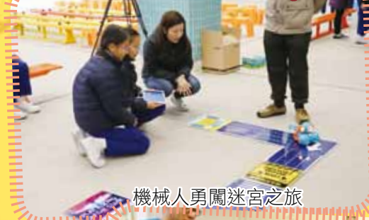
機械人勇闖迷宮之旅