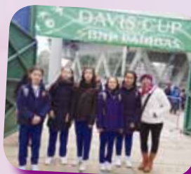
準備觀賞台維斯盃網球比賽

學生在舞蹈的導賞活動中，透過示範和講解，認識了舞蹈在歷史中的變化、現代舞與傳統芭蕾舞和民族舞的不同之處，和現代舞如何反映當今社會的精神面貌。此外，學生亦有機會觀賞國際級球類比賽，在感受大賽氣氛之餘，亦可透過導賞員講解環節學習如何欣賞球賽賽事。在多次活動中，學生均投入觀賞現場表演或賽事，以掌聲或打氣回應表演者或運動員的表演，展現了作為觀眾應有的禮儀。