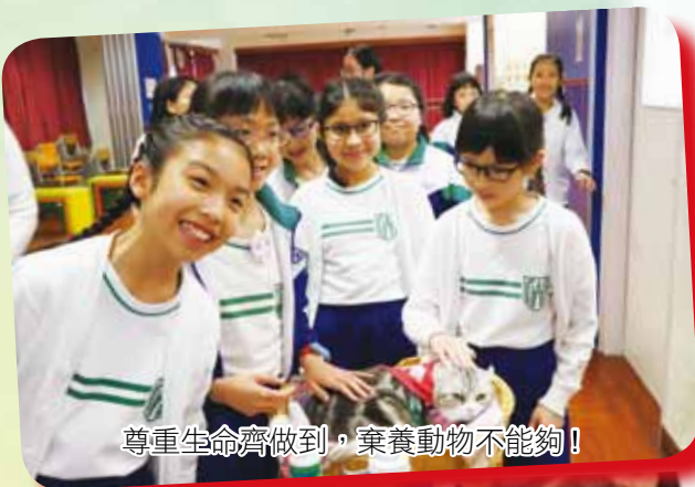
尊重生命齊做到，棄養動物不能夠！

三、四年級學生能因應主題創作精簡易記的宣傳口號，內容也能涵蓋「領養不棄養」的重點，更有組別創作了歌曲，宣傳領養不棄養的信息，令短劇更精彩。