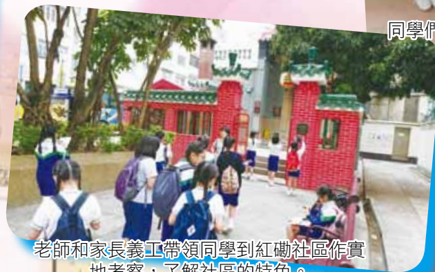
老師和家長義工帶領同學到紅磡社區作實地考察，了解社區的特色。