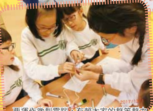
要運作微型電腦，有賴大家的群策群力