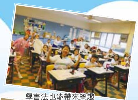
學書法也能帶來樂趣