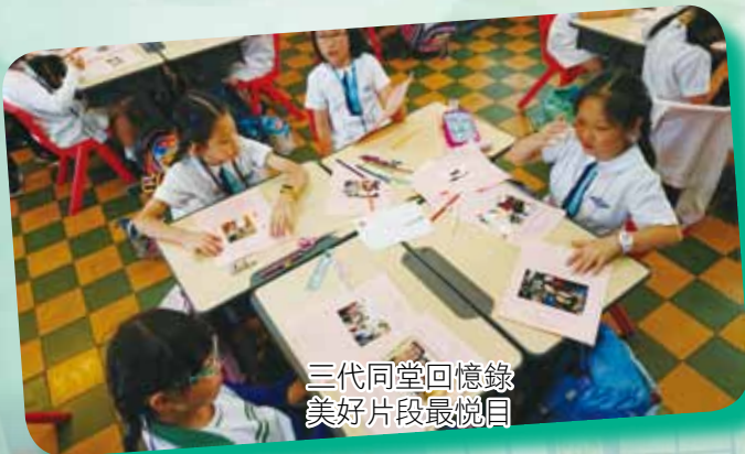
三代同堂回憶錄 美好片段最悅目