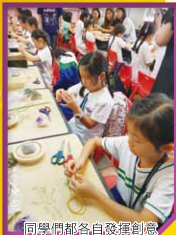
同學們都各自發揮創意

當天，家長與同學們共同創作自己的保鮮花作品，過程中，每組皆十分投入，而且創作力極高，大家都能利用美麗的花材，做出獨特的裝飾。看著每個家庭帶著美麗的製成品及滿足的笑容離開，一班家長委員及義工們都感到十分愜意，期望日後能再有機會為家長和同學們舉辦同類型活動。