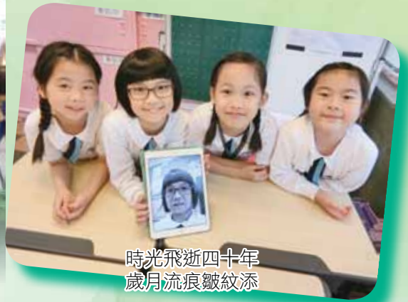
時光飛逝四十年 歲月流痕皺紋添

老師透過繪本故事及護蛋的體驗活動引入主題，同時運用 Aging Booth 應用程式讓學生進行變老樣貌的體驗，又請學生戴上老花眼鏡看景物及戴上厚手套穿珠的體驗活動，好讓她們以同理心看待家中的長輩。她們在校內學會了健康舞後，承諾回家把此段健康舞教給家人，最後再邀請家中長輩到校與同學分享三代相處之道，讓學生明白尊重家中長輩及父母的重要。