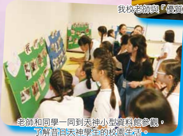
老師和同學一同到天神小型資料館參觀，了解昔日天神學生的校園生活。